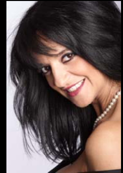
di S. Ninetti